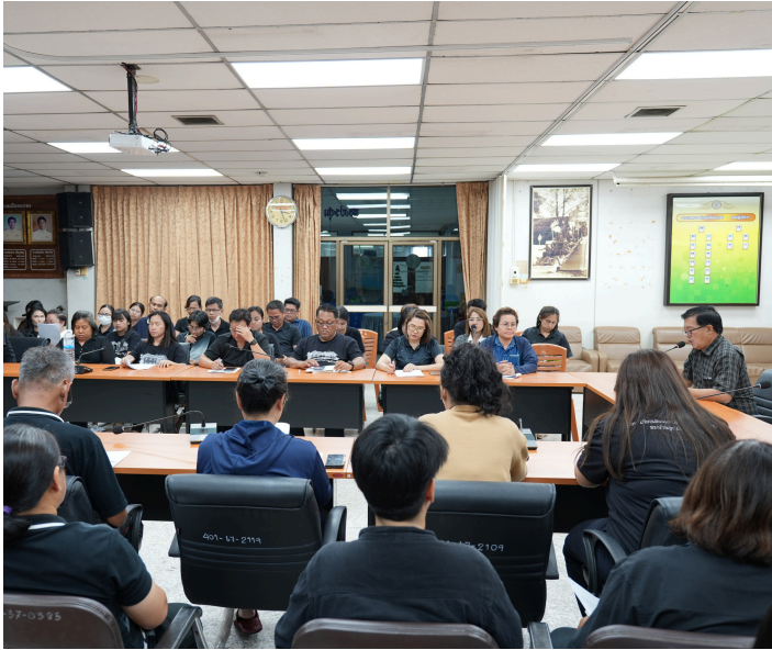
ผลการประเมินรายการเครื่องมือ

ในการประชุมครั้งนี้ เป็นการนำผลการประเมิน ITA ที่ผ่านมา มาวิเคราะห์จุดแข็งและจุดที่ต้องปรับปรุง เพื่อนำไปสู่การกำหนดมาตรการและแนวทางพัฒนาองค์กรให้มีความโปร่งใส ตรวจสอบได้ และลดความเสี่ยงในการทุจริต ซึ่งเทศบาลตำบลเมืองแกลง ได้รับผลการประเมิน ITA ประจำปีงบประมาณ พ.ศ. 2568 อยู่ในระดับผ่านดี (91.44 คะแนน) เพิ่มขึ้นจากผลการประเมินประจำปีงบประมาณ พ.ศ. 2567 ที่ได้รับผลการประเมินอยู่ในระดับผ่าน (90.93 คะแนน) ซึ่งถือว่าบรรลุค่าเป้าหมาย คือ มีผลการประเมิน ITA ในภาพรวม 85 คะแนนขึ้นไป และมีคะแนนรายการเครื่องมือประกอบด้วย IIT, EIT ส่วนที่ 1, EIT ส่วนที่ 2 และ OIT ที่มีค่าคะแนน 85 คะแนนขึ้นไป ซึ่งเพิ่มขึ้นจากผลการประเมินประจำปีงบประมาณ พ.ศ. 2567